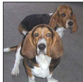
Bogart (en avant) et Roxie

Nous avons appris énormément de Bogart le basset. Il nous a appris à ne jamais baisser les bras lorsqu'il s'agit de trouver le foyer parfait pour un animal. Avec de l'assurance et du caractère à revendre, Bogart est un chien affectueux et chaleureux mais également capable d'entêtement et de détermination, sans parler qu'il pratique l'art de l'écoute sélective!